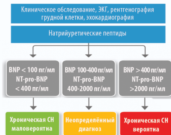
Алгоритм подтверждения/исключения диагноза СН с помощью NT-proBNP [1]

Объективно диагностировать дисфункцию миокарда позволяет биомаркер NT-proBNP - маркер острой и хронической сердечной недостаточности. Почему NT-proBNP? Давайте сравним: